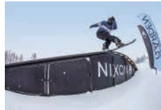
ビギナーからエキスパートまで楽しめるスノーパーク