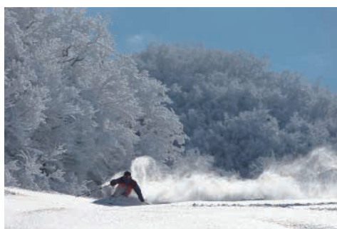
大迫力のオフピステーションでパウダーを満喫!

*1)は平日(割増無し日)に、*2)は年末年始に、それぞれ3名様以上でご利用の場合の大人お一人様の税別料金です。日にち、人数によって割増がございます。