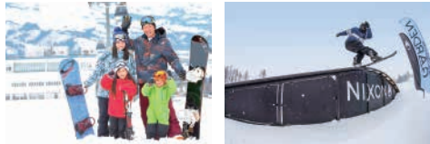
ファミリー向けコースも充実!