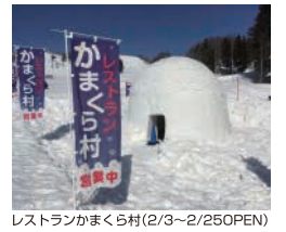
レストランがまくら村(2/3~2/25OPEN)

1泊2食 + リフト2日券 戸狩温泉2日券 = 1名税別 7,700円 (小学生 5,800円)