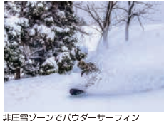
非圧雪ゾーンでパウダースーフィン